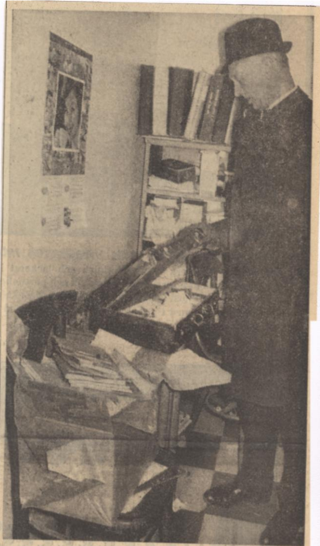
Postmästare M O Gjerulf betraktar förödelsten.