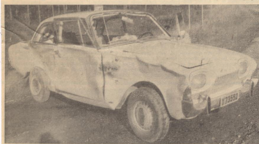
Den svår ramponerade Y-bilen efter krocken. 29/9 1964

Föraren av den andra bilen, hemmahörande i Ursviken undkom utan nämnvärda skador. Han använde säkerhetssele, passagerarna i övviksbilen utnyttjade inte selarna. Båda fordonen blev mycket illa åtgångna.