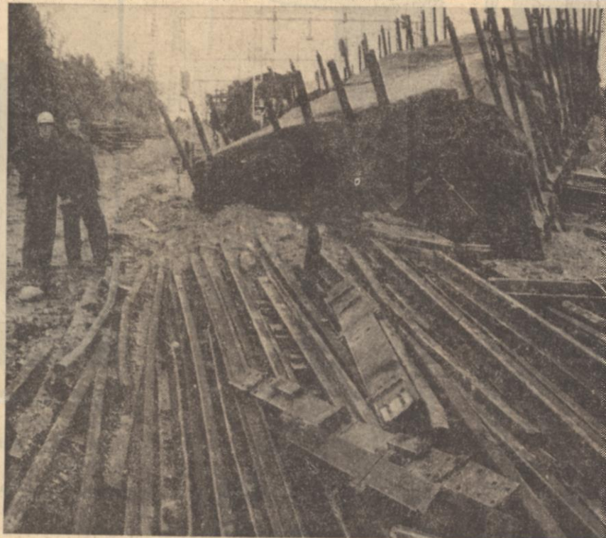
Vagnarna, lastade med masonite och järn, tunga doningar, grävde ner sig i banvallen och blockerade linjen.